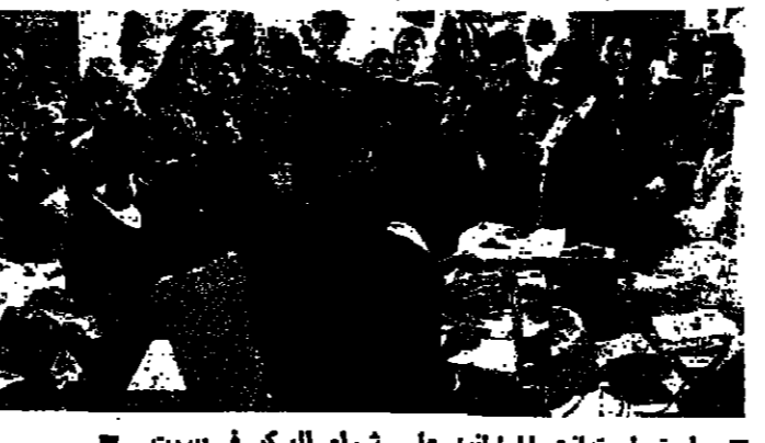
استمرار نهات المواطنين على شراء السكر في بيروت